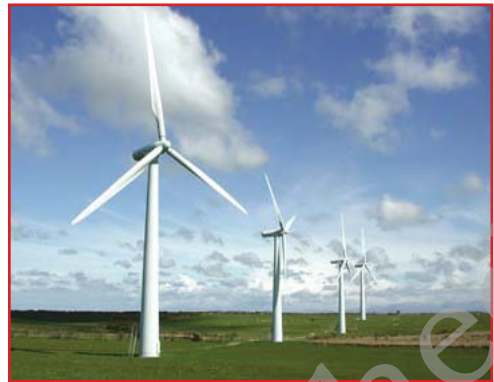
चित्र 1.1: पवन-चक्कियाँ

प्राकृतिक संसाधनों का वितरण भूभाग, जलवायु, ऊँचाई जैसे अनेक भौतिक कारकों पर निर्भर करता है। पृथ्वी पर इन कारकों में विभिन्नता होने के कारण संसाधनों का वितरण असमान है।