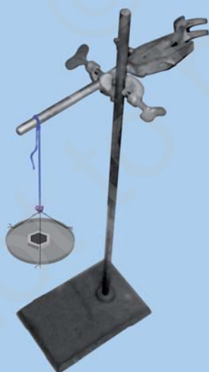
चित्र 3.5 : एक लोहे के स्टैंड पर क्लैम्प से लटकता हुआ एक धागा।

एक क्लैम्प युक्त लोहे का स्टैंड लीजिए। लगभग 60 सेमी लम्बा एक सूती धागा लीजिए। इसे क्लैम्प से बाँध दीजिए जिससे यह स्वतंत्र रूप से लटक जाए, जैसा चित्र 3.5 में प्रदर्शित है। मुक्त सिरे पर