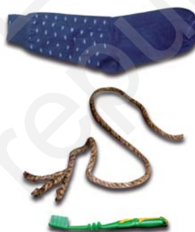
चित्र 3.3 : नाइलॉन से निर्मित विभिन्न वस्तुएँ।

हम नाइलॉन से निर्मित कई वस्तुओं को उपयोग में लाते हैं, जैसे— जुराबें, रस्से, तम्बू, दाँत साफ़ करने का ब्रुश, कारों की सीट के पट्टे, स्लीपिंग बैग (शयन थैला), परदे, आदि (चित्र 3.3)। नाइलॉन का उपयोग पैराशूट