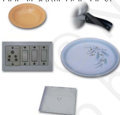
थर्मोसेटिंग प्लास्टिक से निर्मित वस्तुएँ

दूसरी ओर, कुछ प्लास्टिक ऐसे हैं जिन्हें एक बार साँचे में ढाल दिया जाता है तो इन्हें ऊष्मा देकर नर्म नहीं किया जा सकता। ये थर्मोसेटिंग प्लास्टिक कहलाते हैं। दो उदाहरण हैं - बैकेलाइट और मेलामाइन। बैकेलाइट ऊष्मा और विद्युत का कुचालक है। यह बिजली के स्विच, विभिन्न बर्तनों के हत्थे, आदि बनाने में काम आता है। मेलामाइन एक बहुउपयोगी पदार्थ है। यह आग का प्रतिरोधक है तथा अन्य प्लास्टिक की अपेक्षा ऊष्मा को सहने की अधिक क्षमता रखता है। यह फर्श की टाइलें, रसोई के बर्तन और कपड़े बनाने के उपयोग में लिया जाता है जो आग का प्रतिरोध करते हैं। चित्र 3.8 में थर्मोप्लास्टिक और थर्मोसेटिंग प्लास्टिक के विभिन्न उपयोगों को प्रदर्शित किया गया है।