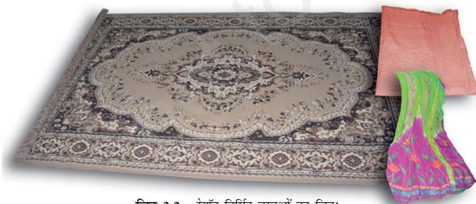
चित्र 3.2 : रेयॉन निर्मित वस्तुओं का चित्र।

आपने कक्षा VII में पढ़ा है कि रेशम कीट से प्राप्त किया जाता है। इसकी खोज चीन में हुई थी और इसे लम्बे समय तक कड़ी सुरक्षा में गोपनीय रखा गया। रेशम रेशे से प्राप्त कपड़ा बहुत मँहगा होता है परन्तु इसकी सुन्दर बुनावट (texture) ने प्रत्येक व्यक्ति को मोह लिया। रेशम को कृत्रिम रूप से बनाने के प्रयास किये गए। उन्नीसवीं शताब्दी के अन्तिम छोर पर वैज्ञानिकों को रेशम समान गुणों वाले रेशे प्राप्त करने में सफलता प्राप्त हुई। इस प्रकार का रेशा काष्ठ लुगदी के रासायनिक उपचार से प्राप्त किया गया। यह रेशा रेयॉन अथवा कृत्रिम रेशम कहलाया। यद्यपि रेयॉन प्राकृतिक स्रोत काष्ठ लुगदी से प्राप्त किया जाता है, यह एक मानव निर्मित रेशा है। यह रेशम से सस्ता होता है परन्तु इसे रेशम रेशों के समान बुना जा सकता है। इसे रंगों की कई किस्मों में रँगा जा सकता है। रेयॉन को कपास के साथ मिलाकर बिस्तर की चादरें बनाते हैं अथवा ऊन के साथ मिलाकर कालीन या गलीचा बनाते हैं। (चित्र 3.2)।