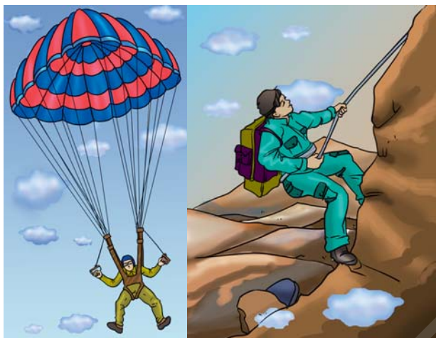
चित्र 3.4 : नाइलॉन रेशों के उपयोग।