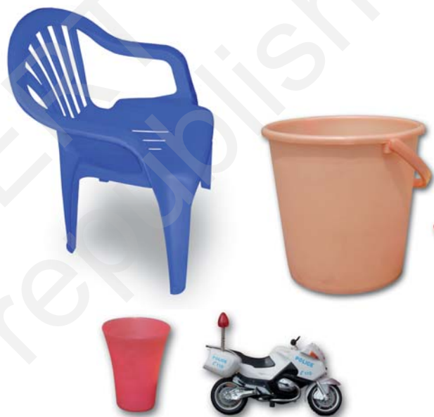
चित्र 3.7 : प्लास्टिक-निर्मित विभिन्न वस्तुएँ

प्लास्टिक की वस्तुएँ सभी सम्भव आकारों और साइजों में उपलब्ध हैं, जैसा आप चित्र 3.7 में देख सकते हैं। क्या आपको आश्चर्य नहीं होता कि यह कैसे संभव है? तथ्य यह है कि प्लास्टिक आसानी से साँचे में ढाला जा सकता है अर्थात् इसे कोई भी आकार दिया जा सकता है। प्लास्टिक का पुनः चक्रण हो सकता है, इसे पुनः प्रयुक्त किया जा सकता है, इसे रंगा और पिघलाया जा सकता है, इसे बेलकर चद्दरों में बदला जा सकता है अथवा इसकी तारें बनायी जा सकती हैं। इसलिए इनके इतने विभिन्न प्रकार के उपयोग हैं।