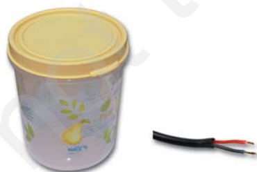
थर्मोप्लास्टिक से निर्मित वस्तुएँ