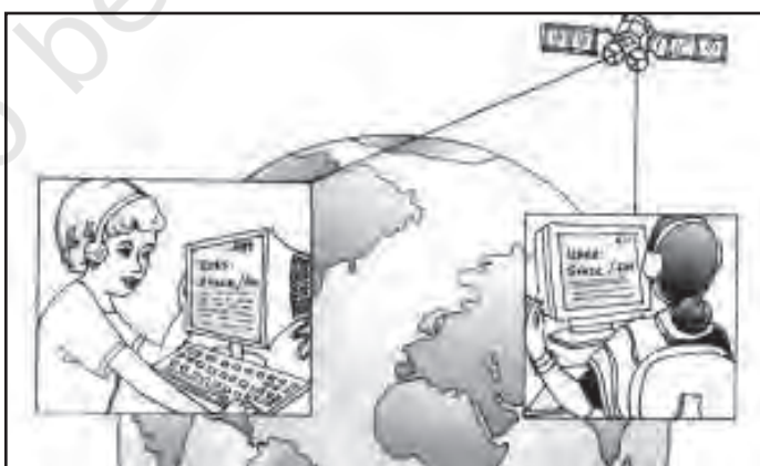
चित्र 3.1 बाह्य प्रापण : बड़े शहरों में रोजगार का एक नया अवसर

सरकार ने सार्वजनिक उपक्रमों को प्रबंधकीय निर्णयों में स्वायत्तता प्रदान कर उनकी कार्यकुशलता को सुधारने का प्रयास किया है। उदाहरण के लिए, कुछ सार्वजनिक उपक्रमों को 'महारत्न', 'नवरत्न' और 'लघुरत्न' का विशेष दर्जा दिया गया है (देखें बॉक्स 3.1)।