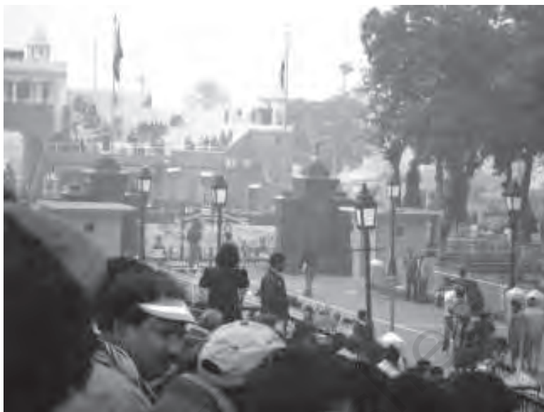
चित्र 10.1 बाघा बॉर्डर केवल पर्यटन स्थल ही नहीं बल्कि भारत तथा पाकिस्तान के बीच व्यापार के लिए भी इसका प्रयोग हो रहा है

अपने पास रख सकते थे। बाद के चरण में औद्योगिक क्षेत्र में सुधार आरंभ किये गये। सामान्य, नगरीय तथा ग्रामीण उद्यमों की निजी क्षेत्रक की उन फर्मों को वस्तुएँ उत्पादित करने की अनुमति थी, जो स्थानीय लोगों के स्वामित्व और संचालन के अधीन थे। इस अवस्था में उद्यमों को जिन पर सरकार का स्वामित्व था, (जिन्हें राज्य के उद्यम एस.ओ.ई. के नाम से जाना जाता है) और जिन्हें हम