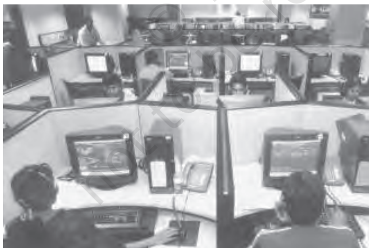
चित्र 3.2 सूचना प्रौद्योगिकी उद्योग का भारत के निर्यात में प्रमुख योगदान

विश्व व्यापार संगठन के एक महत्वपूर्ण सदस्य के रूप में भारत विकासशील विश्व के हितों का संरक्षण करते हुए न्यायपूर्ण विश्वस्तरीय व्यापार व्यवस्था के नियमों तथा सुरक्षात्मक व्यवस्थाओं की रचना में सक्रिय भागीदार रहा है। भारत ने व्यापार के उदारीकरण की अपनी प्रतिबद्धता को बनाए रखा है।