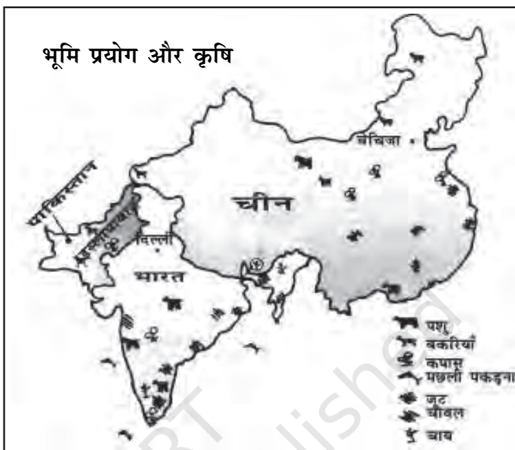
चित्र 10.2 भारत, चीन तथा पाकिस्तान में भूमि-प्रयोग तथा कृषि (स्केल के अनुसार नहीं)

चीन में प्रजनन दर भी बहुत कम है और पाकिस्तान में बहुत अधिक। पाकिस्तान और चीन दोनों में नगरीकरण अधिक है। भारत में नगरीय क्षेत्रों में 32 प्रतिशत लोग रहते हैं।